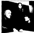
Mariangela Melato in «Quei che sapeva Maisie». A destra, una scena di «Stanza 101».