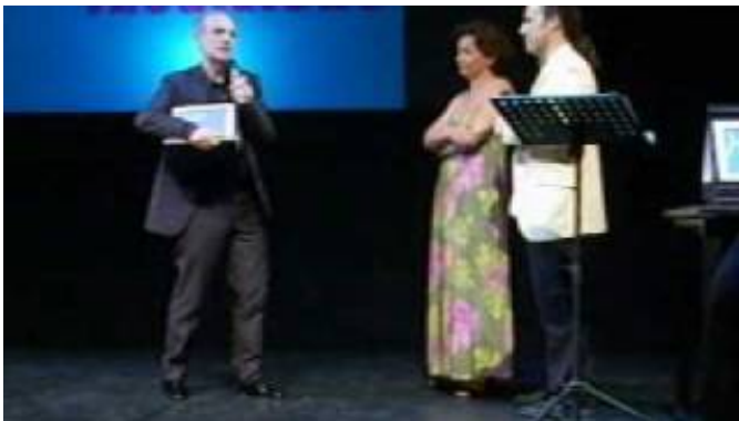
Premio Hystrio alla carriera 2009